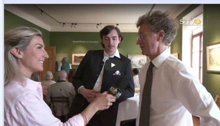
Museum Zinkenbacher Malerkolonie St. Gilgen - www.mkol.at

Text & Bilder: Mag. Robert Schmiedlehner | Ergänzungen & Bilder: in-motion.me