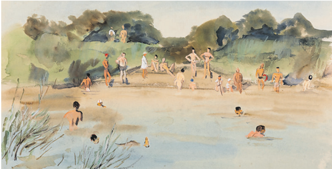
„Nude Camp“ von Lisel Salzer ist eines der Werke, die in St. Gilgen zu sehen sind.