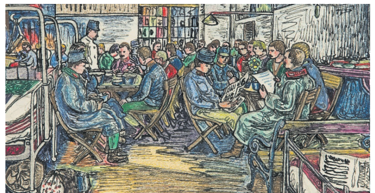
Franz von Zülows „Speiseraum“ aus dem Jahr 1922.

Abseits der jährlich wechselnden Ausstellung in den Sommermonaten will Schediwy-Fuhrmann die Räumlichkeiten des