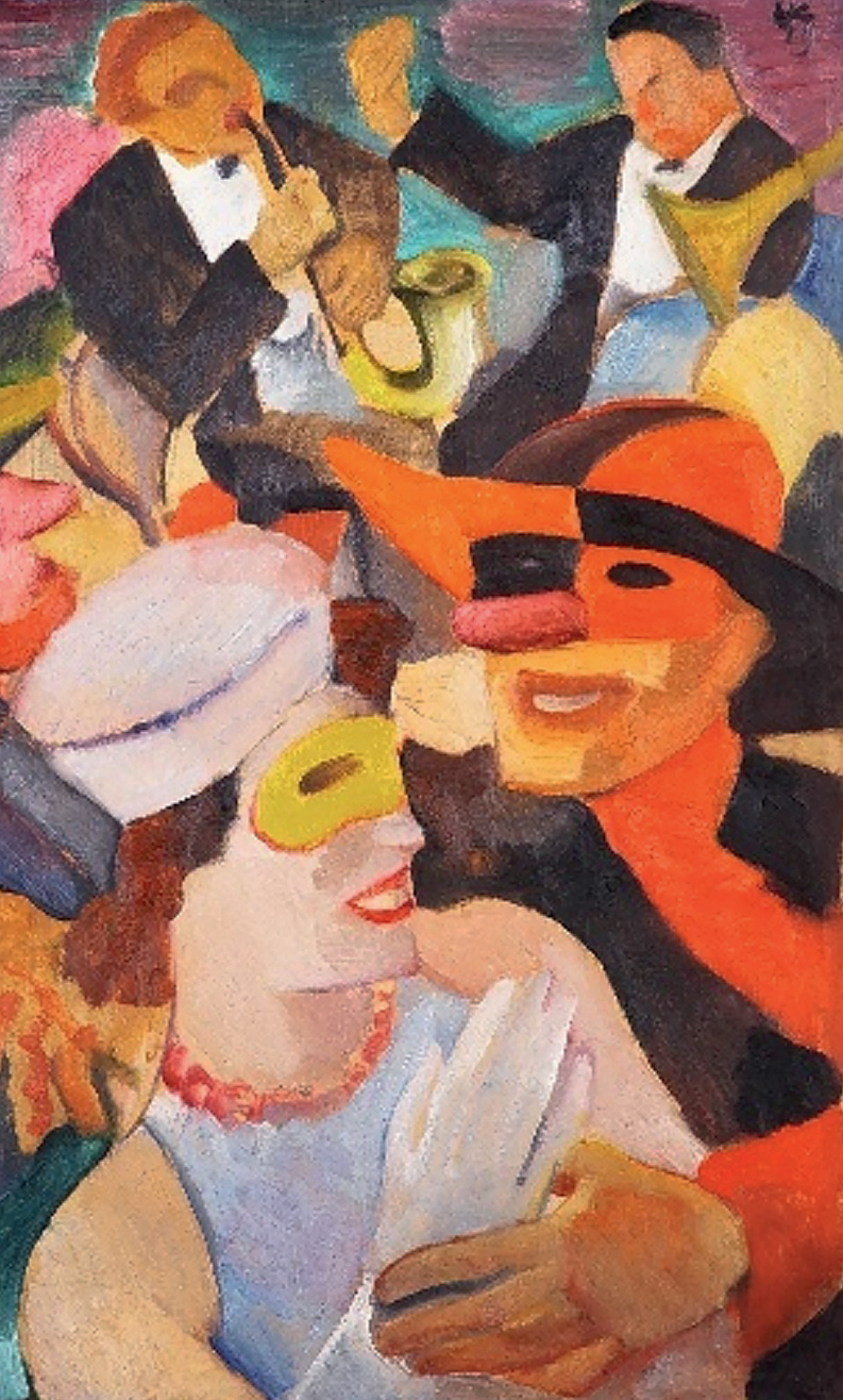
linke Seite | CARRY HAUSER | Jazzband, 1927, Öl auf Leinwand, 50 × 48 cm, Familie Goldscheider | rechte Seite | KARL HAUK | Maskenfest